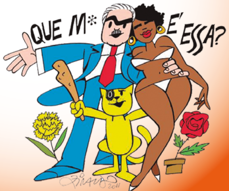
Desenho elaborado como tema de carnaval de um bloco do Rio de Janeiro em 2011

cafro quer parabenizar. Em sua universidade, o que você pode fazer para avançar o debate sobre a discriminação propagada pelos livros? Cabe reparação financeira, frente ao mal causado pela sociedade que difundiu LOBATO?