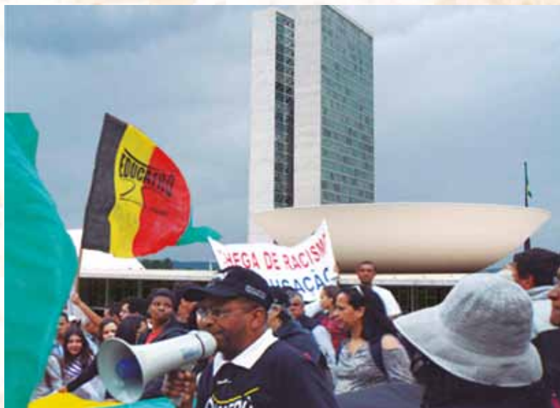
Militantes da Educafro Promovem ato em Brasília

A ONU determinou que 2011 fosse “O ano do AFRODESCENDENTE”. A EDUCAFRO, para enfrentar este desafio, solicitou e conseguiu que o Senado aprovasse uma Audiência Pública sobre este tema. O Presidente LULA, em 2010 assinou o Estatuto da Igualdade Racial. O Governador do Rio